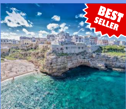
APULIJA OD 610€ 7 dana / 6 noćenja