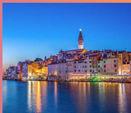
ROVINJ RAZGLED I KUPANJE 1 dan