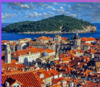
CRES I MALI LOŠINJ, 42 € 1 dan