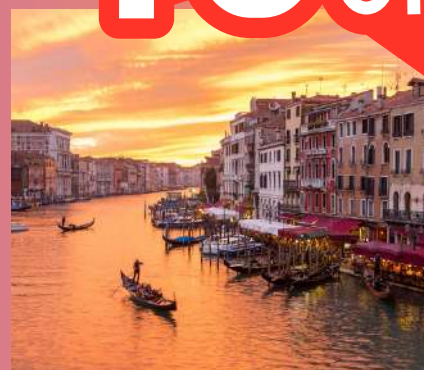
VENECIJA 1 dan