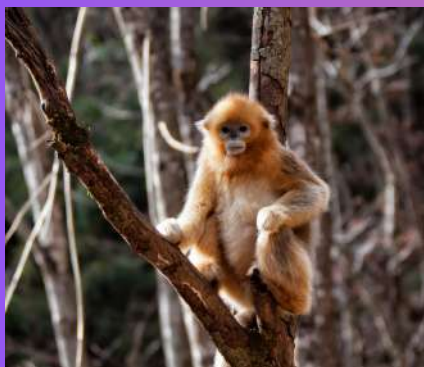
PLANINA MAJMUNA I VLEDEN 39 € 1 dan