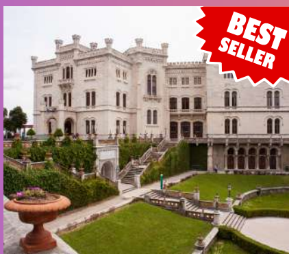
TRST I DVORAC MIRAMARE 1 dan