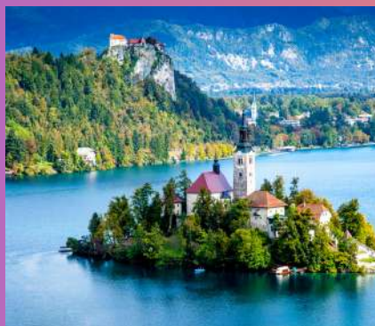
BLED I BOHINJ 1 dan