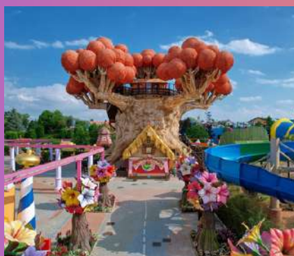
GARDALAND 50 € 1 dan