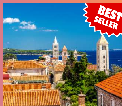
RAB I KUPANJE NA RAJSKOJ PLAŽI 42 € 1 dan