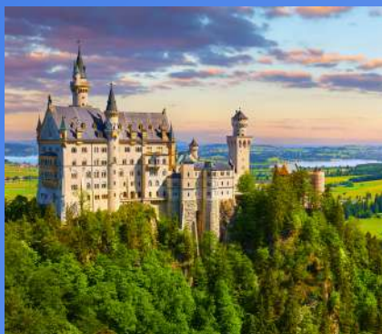
DVORCI BAVARSKE OD 395€ 4 dana / 3 noćenja