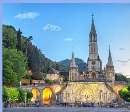
LOURDES OD 435€ 6 dana / 5 noćenja

☎ Rezervacije 099 8194 119 / info@story-travel.com