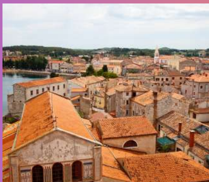
ROVINJ-LIMSKI KANAL- POREČ 42 € 1 dan