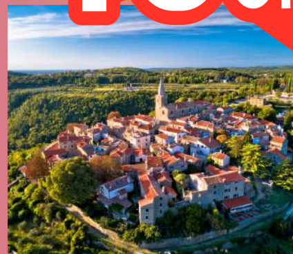
GROŽNJAN- BUJE-UMAG 42 € 1 dan