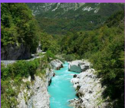
DOLINA RIJEKE SOČE 1 dan