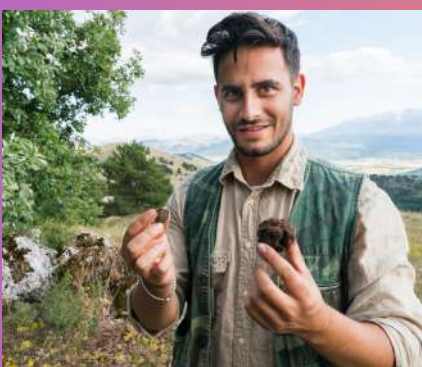
LOV NA TARTUFE U ISTRI + ROVINJ 60 € 1 dan