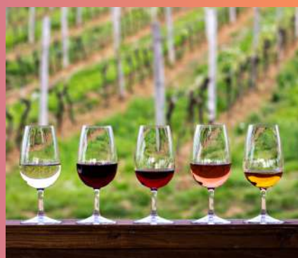
SOSICH WINES & POREČ 69 € 1 dan

📞 Rezervacije 099 8194 119 / info@story-travel.com