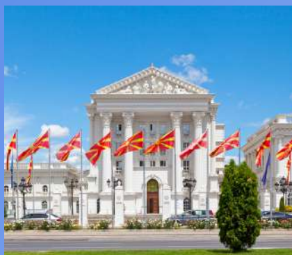
SJEVERNA MAKEDONIJA OD 390€ 5 dana / 4 noćenja