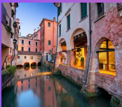
TREVISO 1 dan