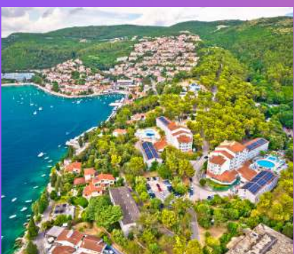
LABIN I KUPANJE U RAPCU 39 € 1 dan