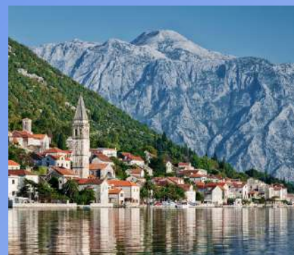
CRNA GORA OD 290€ 4 dana / 3 noćenja