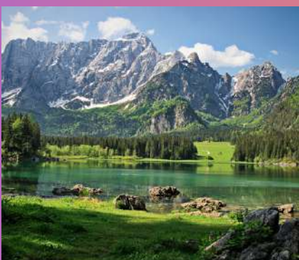
JEZERA JULIJSKIH ALPI 1 dan