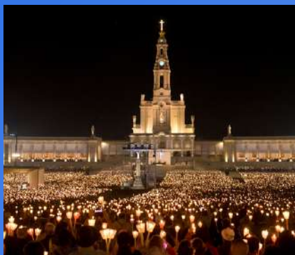
SVETIŠA ZAPADNE EUROPE OD 1100€ 12 dana / 11 noćenja