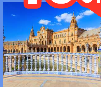
VELIKA ŠPANJOLSKA TURA OD 1250€ 12 dana / 11 noćenja