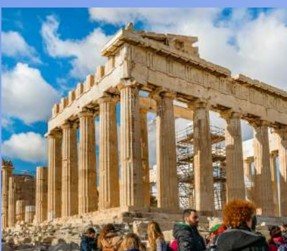
GRČKA OD 545€ 7 dana / 6 noćenja