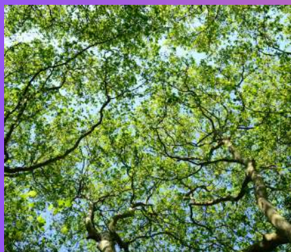
PUT MEĐU KROŠNJAMI MARIBOR 1 dan