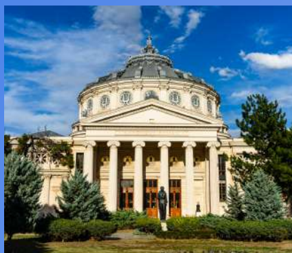
RUMUNJSKA OD 480€ 6 dana / 5 noćenja