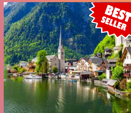
HALLSTAT 1 dan