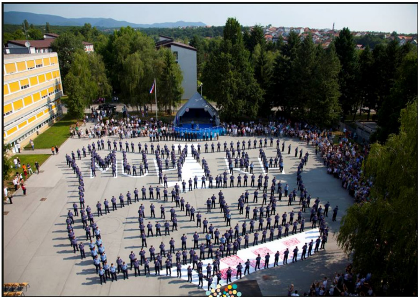
Prisega na Policijskoj školi Josipa Jovića 476. Milenijska Šime Strikomana