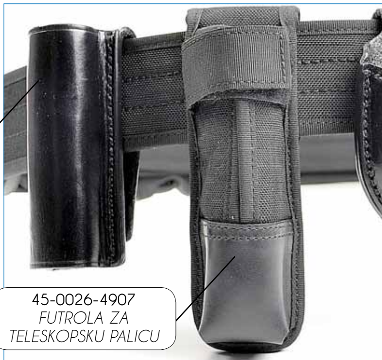
45-0026-4907 FUTROLA ZA TELESKOPSKU PALICU