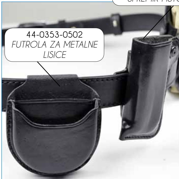
44-0353-0502 FUTROLA ZA METALNE LISICE