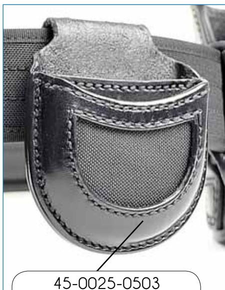
45-0025-0503 FUTROLA ZA SREDSTVA ZA VEZIVANJE (LISICE)