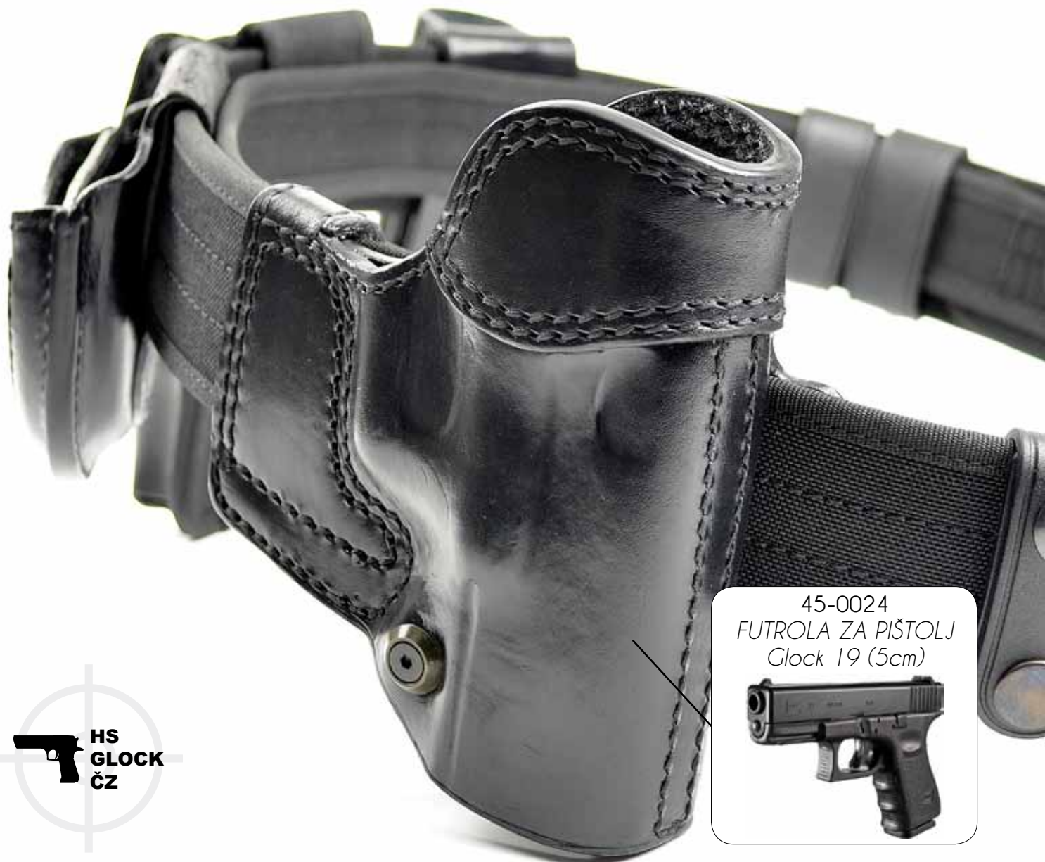
45-0024 FUTROLA ZA PIŠTOLJ Glock 19 (5cm)

KOMPLET ZA NOŠENJE ORUŽJA I OPREME KOŽA / CORDURA