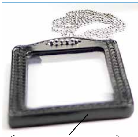
45-0031-0503 KOŽNI ETUI ZA SLUŽBENU ISKAZNICU