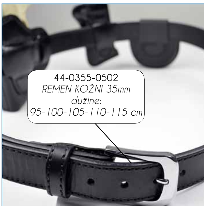
44-0355-0502 REMEN KOŽNI 35mm dužine: 95-100-105-110-115 cm